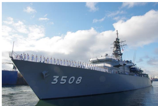
20日, ノース・バンクーバー市バラード・ドライ・ドック出港