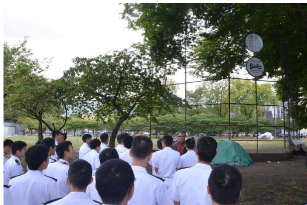
19日, 旧日本人街ウォーキング・ツアー