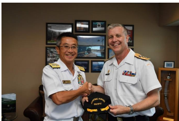
18日、加海軍アート・マクドナルド少将表敬