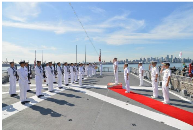
16日、加海軍ジェフリー・ズウィック准将に対する栄誉礼