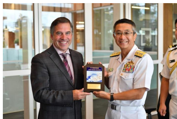
19日, ムサット・ノース・バンクーバー市長表敬