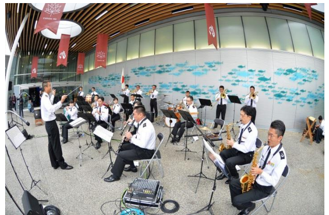
17日、音楽隊による演奏