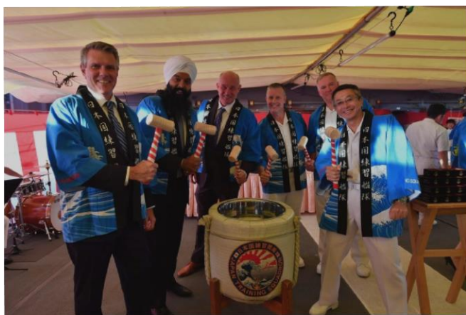
16日, 眞鍋司令官・門司大使共催艦上レセプション