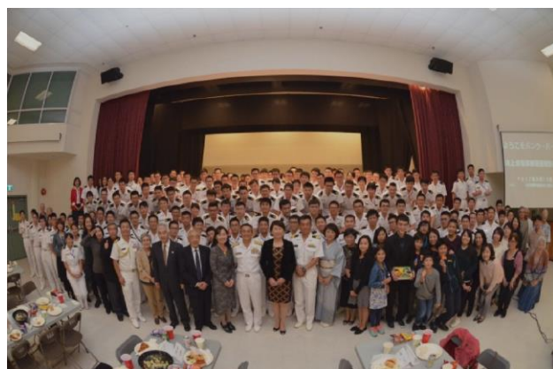
19日, バンクーバー日本語学校主催歓迎会