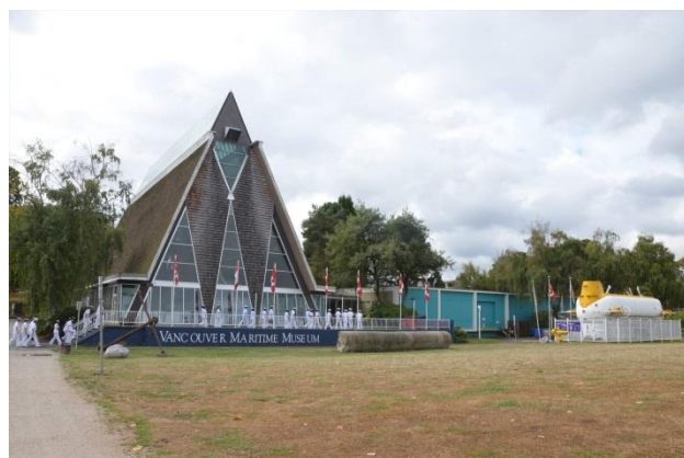
19日, バンクーバー海洋博物館見学