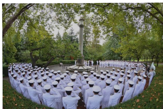
19日, 日系人戦没者慰霊碑献花(スタンレー・パーク)