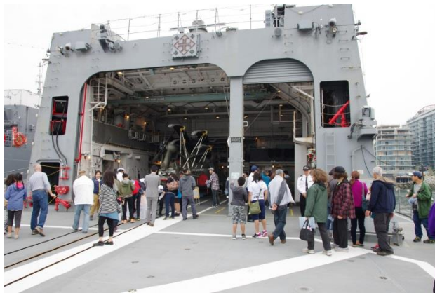
17日、はるさめ艦内特別公開