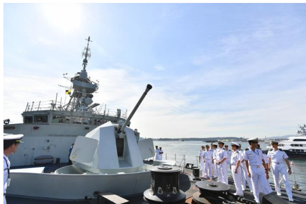
16日, 加海軍艦オタワ見学