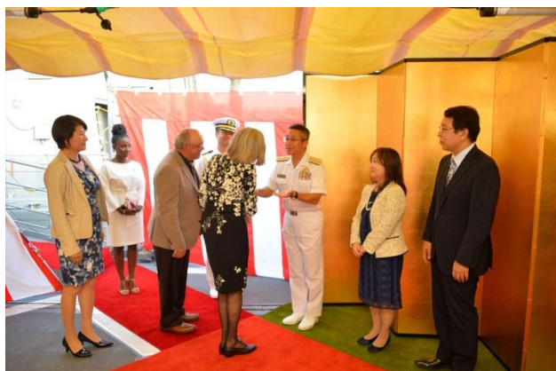
16日, 眞鍋司令官・門司大使共催艦上レセプション