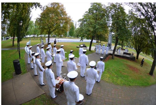
19日, 加軍戦没者慰霊碑献花(ビクトリア・パーク)