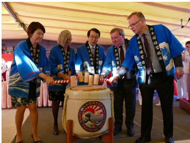
16日, 眞鍋司令官・門司大使共催艦上レセプション