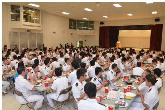
19日, バンクーバー日本語学校主催歓迎会