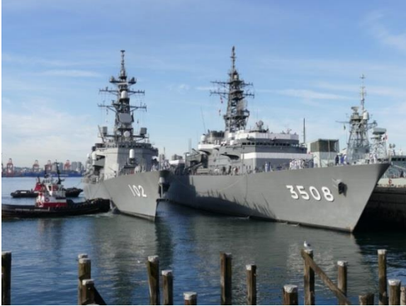
16日、ノース・バンクーバー市 バラード・ドライ・ドック入港

9月16日から20日まで、海上自衛隊の練習艦隊「かしま」及び「はるさめ」がバンクーバー(ノース・バンクーバー市 Burrard Dry Dock)に寄港しました。寄港中には、艦上レセプション、練習艦の一般公開、戦没者慰霊碑への献花、練習艦隊の音楽隊による演奏・太鼓演奏・剣道デモンストレーション、加海軍との交流行事等、様々な行事が開催されました。