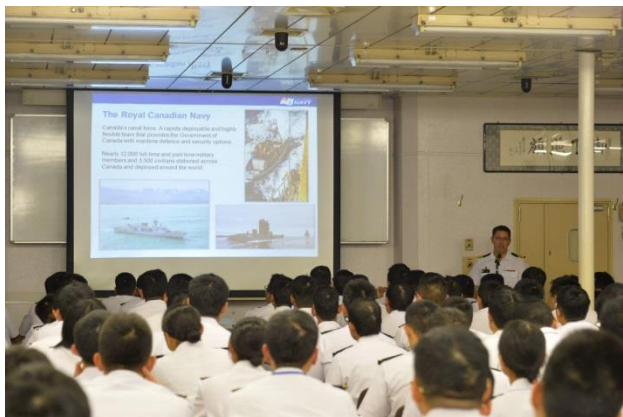
16日, 加海軍スコット・ケルメン少佐による講話