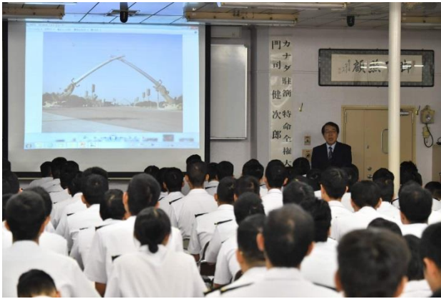
16日、門司大使による講話